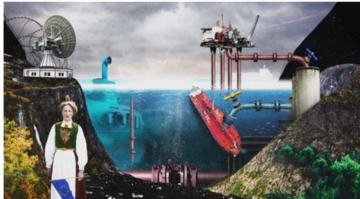
Illustrasjon: Martin Losvik