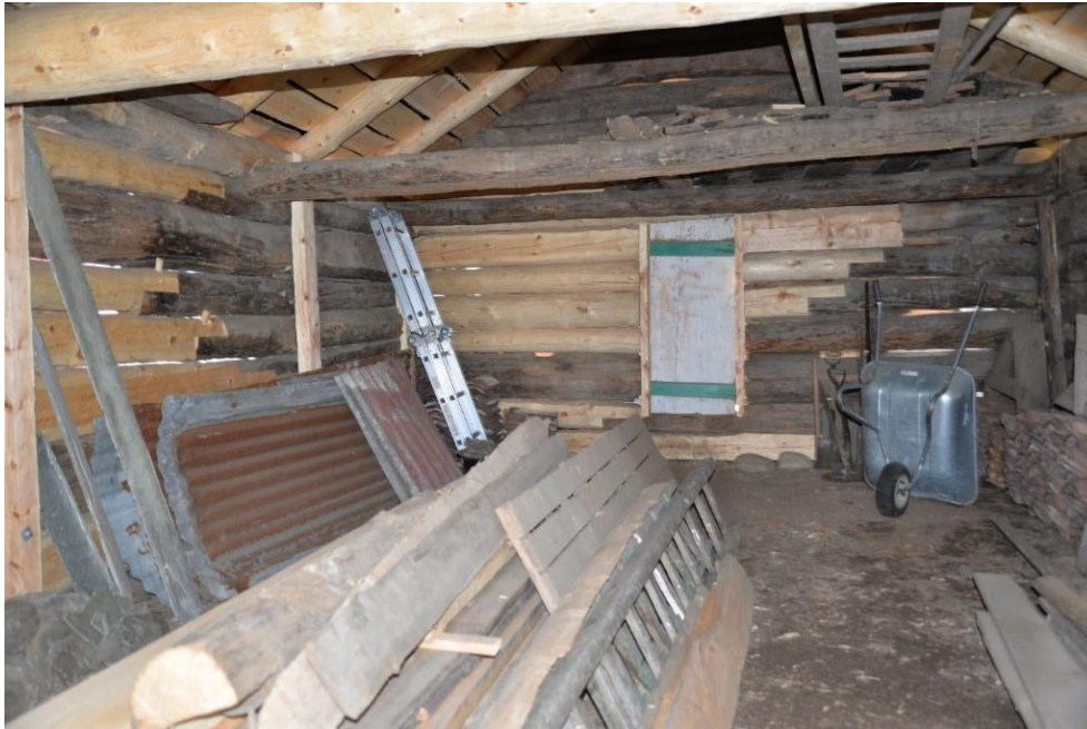
Figur 19. Naustet innvendig etter at konstruksjonen og taket var sett i stand. Foto Stig Nordrumshaugen, 2019.

All material som var hogd i skogen var tatt på dimensjon. Dvs. at stukkane var nær den dimensjonen dei skulle ha som ferdig material i konstruksjonen. Sperrere i ein takkonstruksjon vert betydeleg sterkare av ikkje å sagast, men berre berkast. Dette er ein del av den gamle byggjeskikken i vårt området på slike uthus. Opphavlege sperr har bore eit torvtak, og var difor godt dimensjonerte for å bere tunge lastar. Torvtaket var seinare blitt skifta ut med teglpanner.