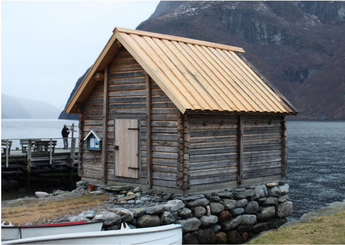
Fig. 6. Rekonstruert naust med bordtak i Undredal. Foto, Arlen Bidne VLFK, 2011.