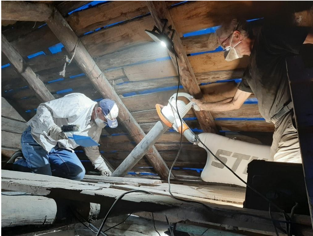
Figur 9. Rydding

av naustet før istandsetjing. Foto Alf Tore Hommedal, 2018.