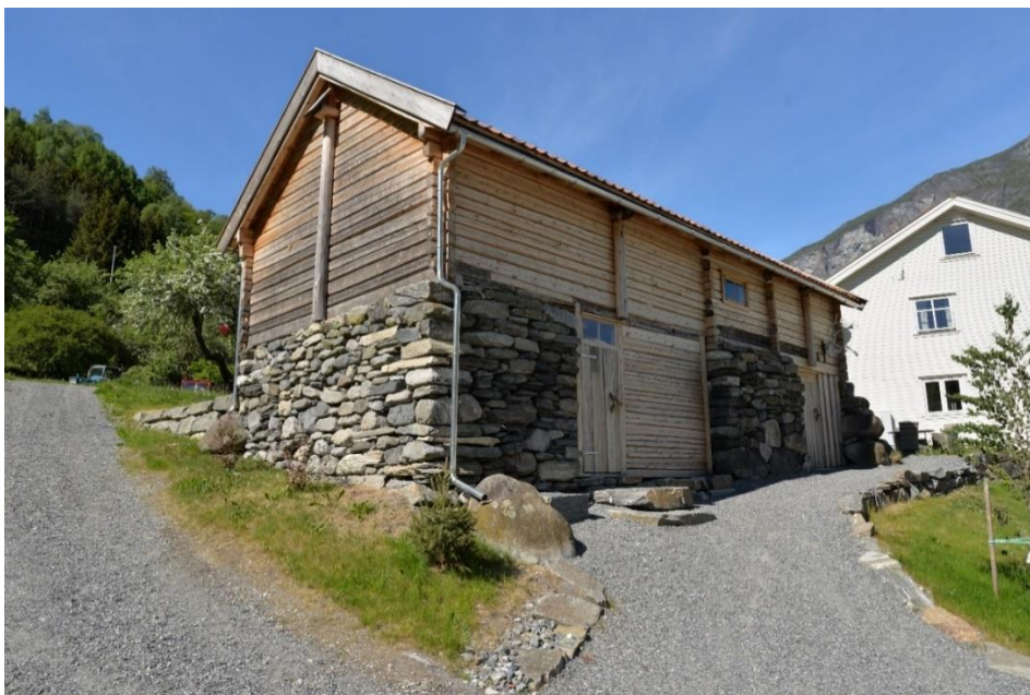
Figur 4. Etter istandsetting. Murane på Hansalåni vart sett opp att og det meste av konstruksjonen måtta laftast opp att.

Typisk for området i Indre Sogn er at ein har nytta åkerstein som i liten grad har vore bearbeidd (tukta). Ofte finn vi dårlege forband i slike murer, fordi det har vore nytta relativ liten stein. I mange tilfelle er det berre stabling av stein som har vore metodikken. Det kan vere utfordrande å halde ved like eller reparere slike murer. I somme tilfelle lyt ein supplere med nokre større steinar slik at ein får betre band i murane. Då er det viktig å finne stein frå same området/region for å bevare det same uttrykket på murane.