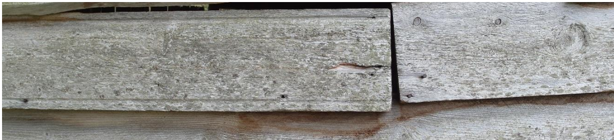
Figur 9. Dei høvla rennene på kvar kant av bordet syner ombruk av takord.

Ofte finn ein både ståande og liggjande kledning på hus. Liggjande kledningsbord er som oftast kanta på sag eller med øks. Ved å kante borda får man mindre yteved (geitved) som på furu er svak for røte og insektangrep. Det er i hovudsak furu som har vore nytta, men vi finn også at ein har nytta lauvtre som t.d. osp i somme tilfelle. På liggjande kledning har det vore mest vanleg å leggje borda med rettsida ut (mergsida). Rettsida er meir slitesterk, og ein får ein meir varig material når ein følgjer dette prinsippet. Ombruk av kledning og takbord som kledning finn vi òg ein del døme på. Det er difor viktig å sjå nærare på kva bord som har vore nytta på det objektet ein skal sette i stand.