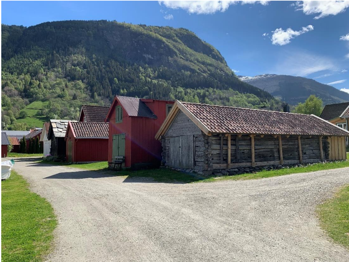
Figur 10. Prosjektet er fullført! Ved sluttrapportering får eigar ut det resterande tilskotet. Foto Arlen Bidne/VLFK, 2021.

Ved å bruke kompetente handverkarar sikrar vi at det tradisjonelle handverket vert styrka og at kunnskapen vert halden i live. Utan denne kunnskapen mistar vi kulturarven og kunnskapen om dei berekraftige byggjeskikkane vi har i Vestland fylke. Ta gjerne kontakt med fylkeskommunen t.d. for råd og rettleiing i forhold til handverkarar eller andre spørsmål.