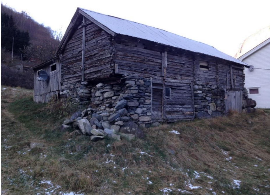
Figur 3. Før istandsetting.

Hansalåni i Undredal vart eit svært omfattande prosjekt. Låni hadde store husbukkangrep og utrasa grunnmur.