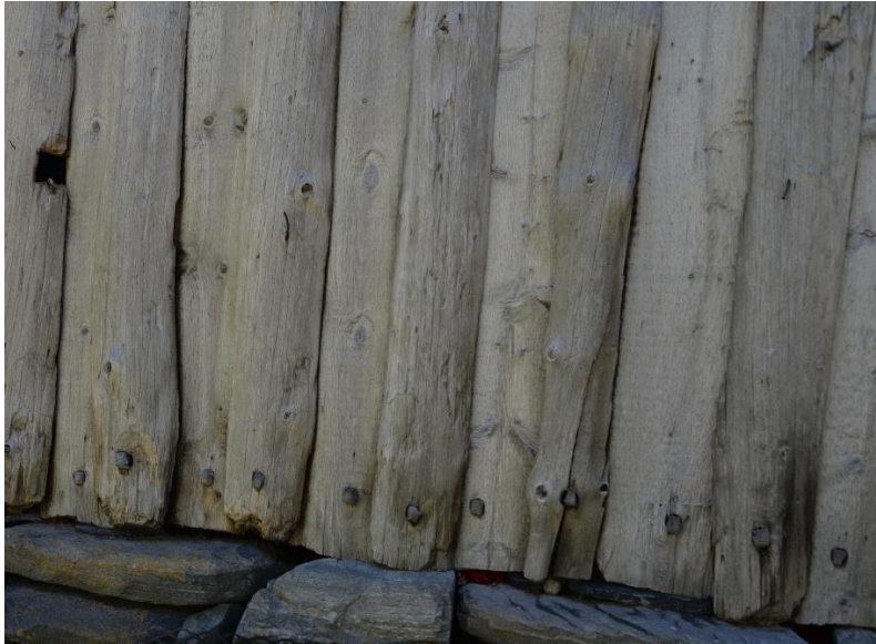
Figur 7. Heimeløe på Bakka.

I hovudsak er det kledning av furu som har vore nytta til tekking av hus i verdsarvområdet. Det har vore vanleg å nytte seg av heile stokken slik vi ser på fig. 7. Dei ulike teknikkane ved å kle hus er viktig å bevare på kvart objekt. Dersom ein må byte ut heile veggjar med kledning er det ønskjeleg å kopiere den opphavlege kledningen og tekkemetoden.