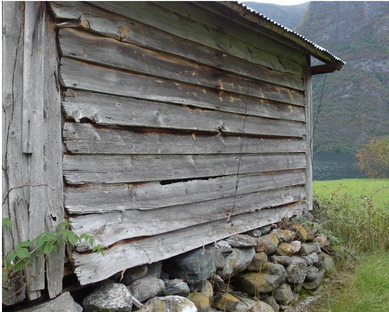
Figur 8. Utløe i Dyrdal.