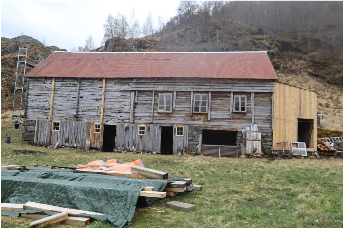
Figur 5. Løa på Øvste Stegen er eit godt døme på varsam istandsetting. Konstruksjon, mur og fundament, vindauge og kledning har vore sett i stand. Foto Jorunn Vallestad/Statsforvaltaren, 2021.