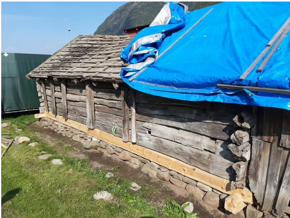
Figur 18. Naustet

og Figur 17. Rett material til objektet. Naustet var lafta med furutømmer. Nytt tømmer vart hogd i nærområdet etter at eigar fekk positivt svar på søknad om tilskot. i dette tilfellet var det Norsk kulturminnefond som støtta istandsetjinga.