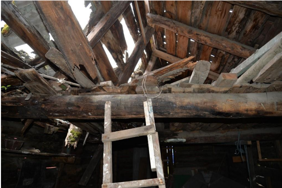
Figur 7.

Naustet hadde stått i mange år med store taklekkasjar. Ny eigar gjekk ved årskiftet i gang med førstehjelp og sikring av naustet med innvendig avstiving og utvendig presenning.