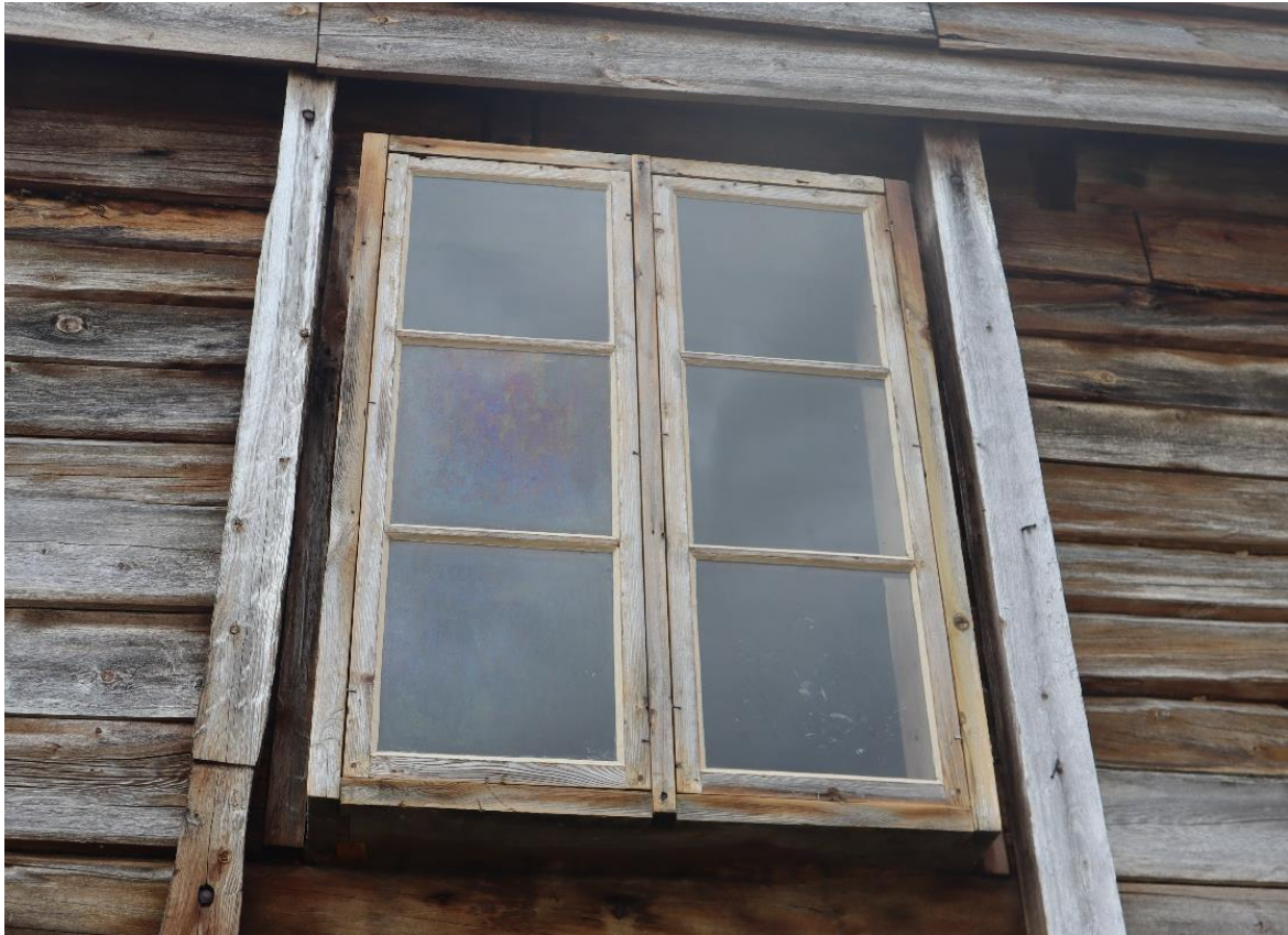
Figur 11. Nystelte vindauga. I mange tilfelle har ein ikkje måla vindauga tidelgare. Det vart gjerne ikkje prioritert på uthus. Foto Jorunn Vallestad/Statsforvaltaren, 2021.