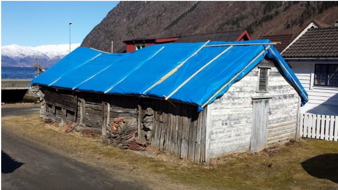
Figur 8. Mellombels sikring av naustet før istandsetjinga startar. Foto S. Nordrumshaugen/VLFK, 2018.

Naustet hadde stått i mange år med store taklekkasjar. Ny eigar gjekk ved årskiftet i gang med førstehjelp og sikring av naustet med innvendig avstiving og utvendig presenning.