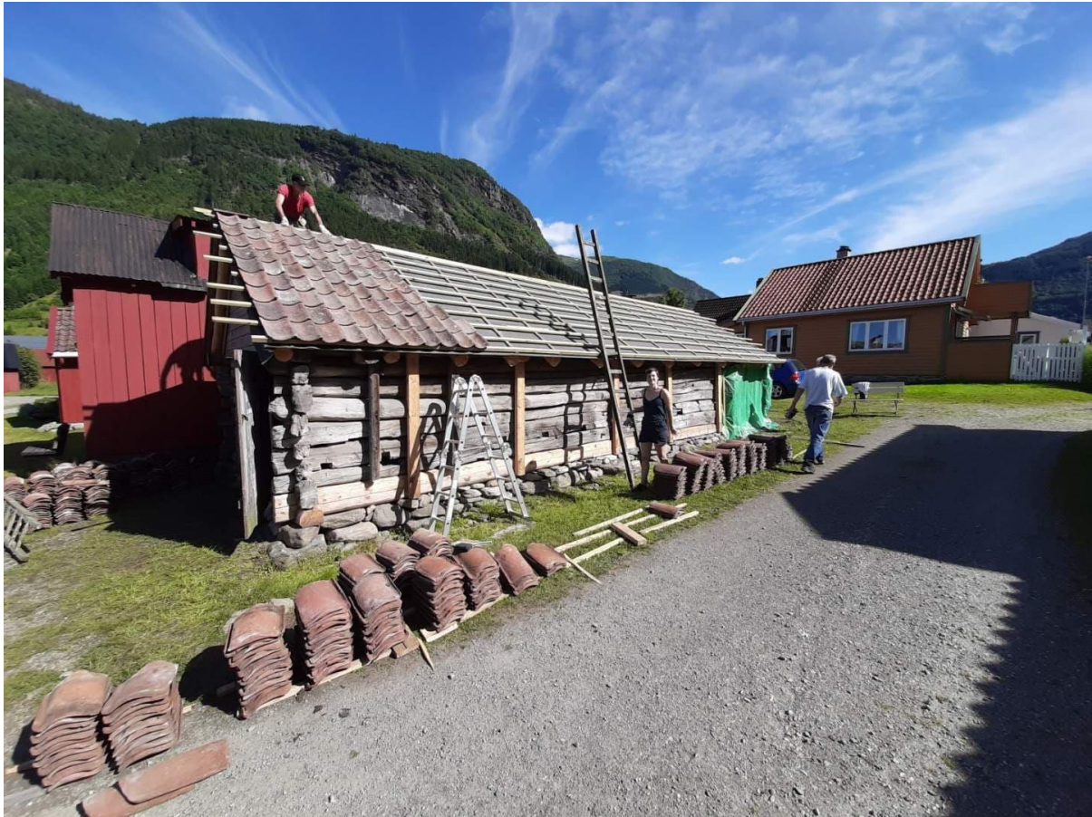
Figur 21. Legging av takpanner. Foto Alf Tore Hommedal, 2019.

Eigaren, som ikkje sjølv er handverkar, bidrog med mykje praktisk arbeid i prosjektet for å halde kostnadane nede, også ved hjelp av dugnad: Førebuing, skaffe tømmermaterialar; frigjere steinfundamenta for jordvekst og seinare utbetre fundamenta; kle reisverkstilbygg; ta ned, sortere og reinske teglpannene og skaffe supplerande panner; vedvarande rydding og tilrettelegging under handverkarane sin arbeidsprosess; dokumentering av heile restaureringsprosessen. Slikt arbeid kan gå inn som ein del av eigendelen i dei totale kostnadene i prosjektet. Eigara la ved dugnad også tilbake teglpannene.