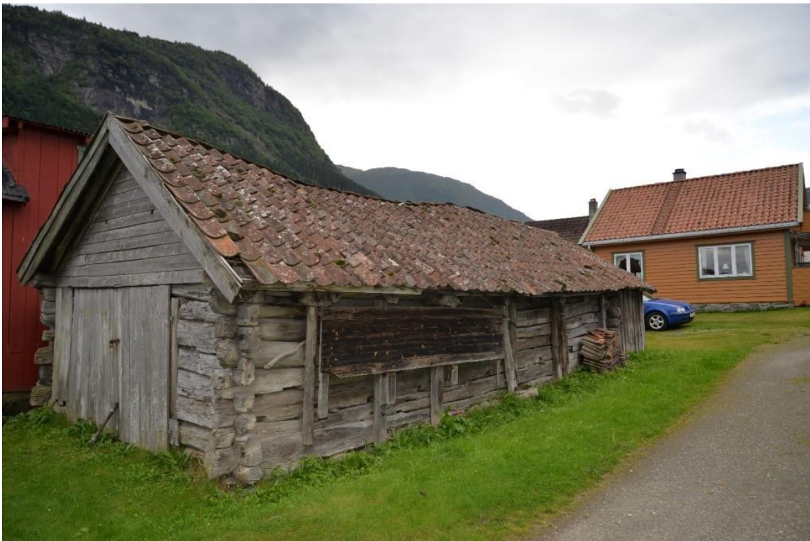
Figur 6. Naustet før istandsetjinga.

Vi har mange døme på hus som går ut av bruk, og eigarar som ikkje lenger klarer å vedlikehalde ein større bygningsmasse knytt til gardsdrift eller fritidshus. Blixnaustet på Vikøyri var eit slikt døme. Bygningen stod med store hol i taket, og var på veg ned. Redninga i dette tilfellet var ein ny eigar som ville berge det siste tømra naustet på Vikøyri for ettertida. I dialog med kommunen og fylkeskommunen, gjekk den nye eigaren i gang med å søkje Norsk Kulturminnefond om støtte til istandsetting. Arbeidet vart igangsett straks søknaden vart innvilga. Under følgjer eit kortfatta utdrag av prosessen.