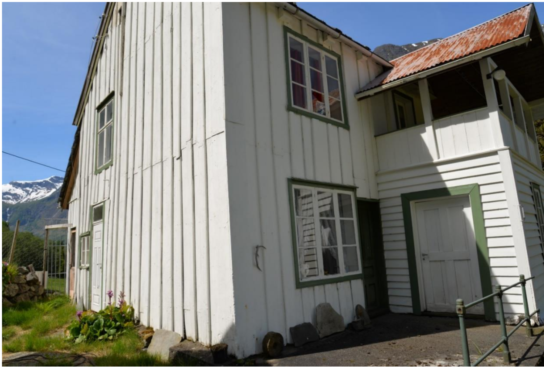
Hus frå 1850-talet på Styvi. Foto Stig Nordrumshaugen/VLFK, 2021.

Gamle dører og vindauge er ein vesentleg del av fasadane på gamle hus. Dei er som oftast bygde med material av god kvalitet som kan stå svært lengje med enkelt vedlikehald.