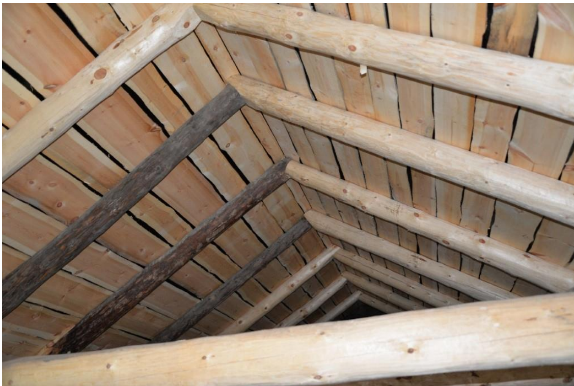
Figur 20. Takkonstruksjonen etter istandsetjinga. foto Stig Nordrumshaugen, 2019.

All material som var hogd i skogen var tatt på dimensjon. Dvs. at stukkane var nær den dimensjonen dei skulle ha som ferdig material i konstruksjonen. Sperrere i ein takkonstruksjon vert betydeleg sterkare av ikkje å sagast, men berre berkast. Dette er ein del av den gamle byggjeskikken i vårt området på slike uthus. Opphavlege sperr har bore eit torvtak, og var difor godt dimensjonerte for å bere tunge lastar. Torvtaket var seinare blitt skifta ut med teglpanner.