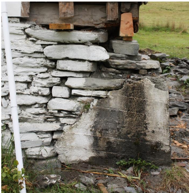
Figur 2. Grunnmur i stein som har blitt reparert med betong. Dette er ein ikkje-ønska metode for reparasjon.

I hovudsak er murer og fundament reist med stein funne i same område som ein har bygd hus. Det kan vere åkerstein eller stein henta frå ras område og elvefar. Det kan vere enkle eller doble murer fylde med jord og grus, ettersom kva funksjon huset eller kjellaren har hatt. Kjenneteikne på murverk i denne regionen er at det har vore nytta mykje handleg stein. Ofte kubiske og såleis utfordrande å mure med. I mange tilfelle er det meir stabling av stein enn muring i forband. Men i eit relativt tørt klima med gode drenerande grusmassar, har murane stått tåleg bra i fleire generasjonar. Det er viktig å vidareføre tradisjonane med bruk av ressursane og muring med stein utan bindemiddel.