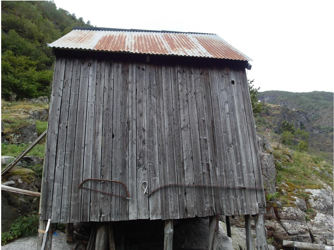
Figur 10. Utløe på Stokko. Døme på stande kledning kant i kant.