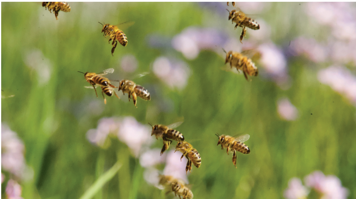
Bier på veg inn i bikuba med pollen og nektar.