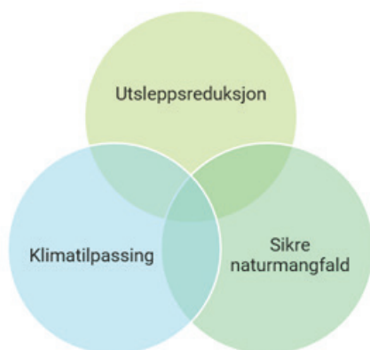
Figur 2: Hovudområda i Klimaomstilling

tilpassar oss til dagens og framtida sitt klima. Ein del av arbeidet med redusert klimagassutslepp er å ha eit fokus på karbonbinding, både gjennom opptak og lagring i skog og jord, samt utarbeiding av ny teknologi. Nye tiltak må sjåast i samanheng for å lukkast med ei berekraftig utvikling.