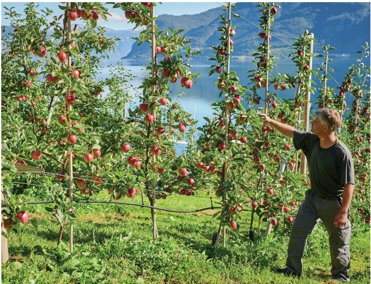
Eit endra klima vil påverke lokal matproduksjon. Her frå ein av mange fruktprodusentar i Vestland, dette frå Leikanger.

Det vert føreslått å etablere ei administrativ og ei politisk referansegruppe for planprosessen. Desse vil undervegs fungere som gode diskusjons- og forankringsgrupper, og ressursar i utarbeiding av planen. Etter vedtak av planen vil desse gruppene kunne vidareførast som samarbeidsorgan for oppfølging av klimaplanen. Planprosessen vil på denne måten også skape gode samarbeidsarenaer for klimaarbeid i regionen og oppfølging av vedtekne mål og tiltak.